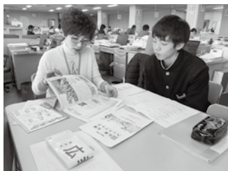
▲市のことや広報のことについて教えてもらい、勉強になりました。