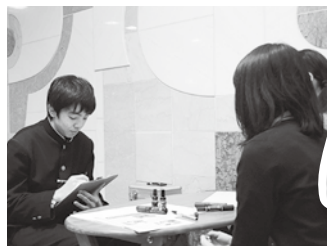
▲知らない方に取材するのは、勇気がいりました。でも、自分の質問に答えてもらえてうれしかったです。