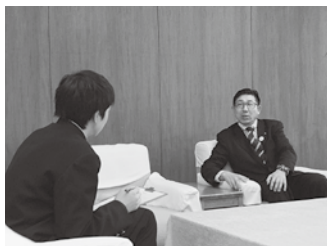
▲市長さんへの取材は、緊張しましたが、貴重な体験でした。