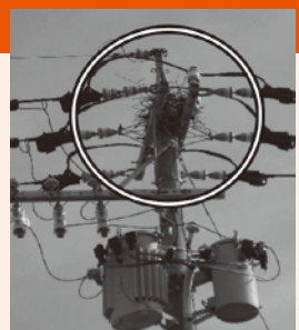
▲電柱上のカラス巣作り状況