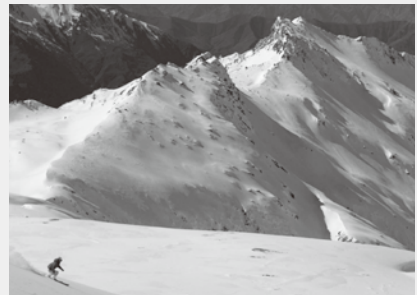
▲ニュージーランドでのヘリスキー(シュリさん)

冬季の練習は国内でできる場がなかなかないので、国外に出向くことが多いですね。ただ、筋力トレーニングなどは国内でもできるので、身近なところでは、自宅屋上のトランポリンや、いきいき広場のマシンスタジオ、近隣市の体育館などを使っていますよ。