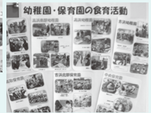
第3回こども食育発表会の会場展示