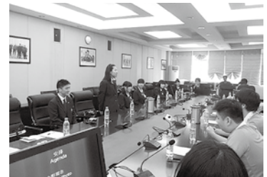
▲南京外国語学校での交流会

消防士になりたいです。ハイパーレスキュー隊に憧れています。中国訪問のために、中国語や英語も勉強しましたし、将来は、国際的な感覚も持って仕事ができればと思います。