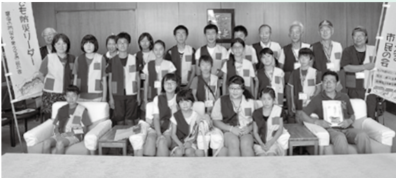
▲ 8/20 訪問 こども防災リーダー被災地訪問報告