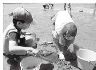
▲渡し場かもめ会 「美しい海をふたたび事業」 (干潟の生き物を調べよう)