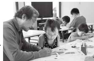
▲高浜南部まちづくり協議会 「子どもの健全育成事業」 (ペーパークラフト講座)