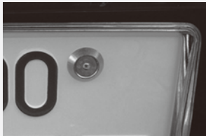
盗難防止ネジを装着したナンバープレート

ナンバープレートは再取得も可能ですが、それには時間も費用もかかるので、まずは犯罪に利用されないよう盗まれないようにすることが大切です。