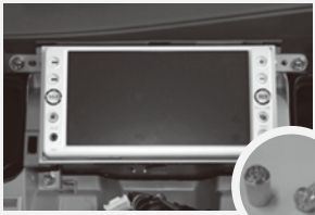
カーナビ盗難防止ネジ

また、セキュリティー機能付きのカーナビは、盗難後の転売が困難となるため、抑止効果が期待できます。