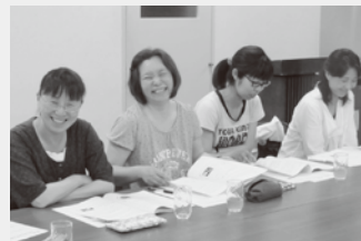
女性陣の元気な笑顔と生活者の視点も重要なポイント