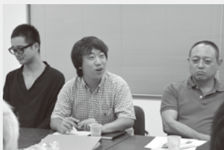
いろいろな職業の方の集まりで、互いの知識に興味深々