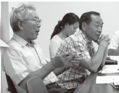
防犯・防災分科会