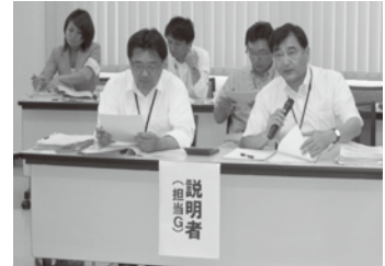
(6月30日に実施された「公開ヒアリング」の様子)