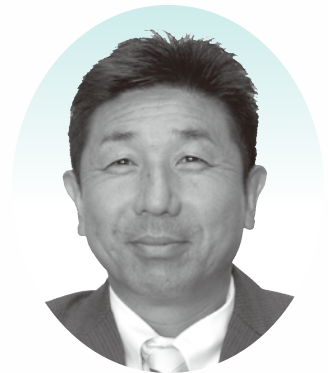
高浜市長 吉岡 初浩

皆さま、新年あけましておめでとうございませう。年頭にあたり謹んで新年のごあいさつを申し上げます。