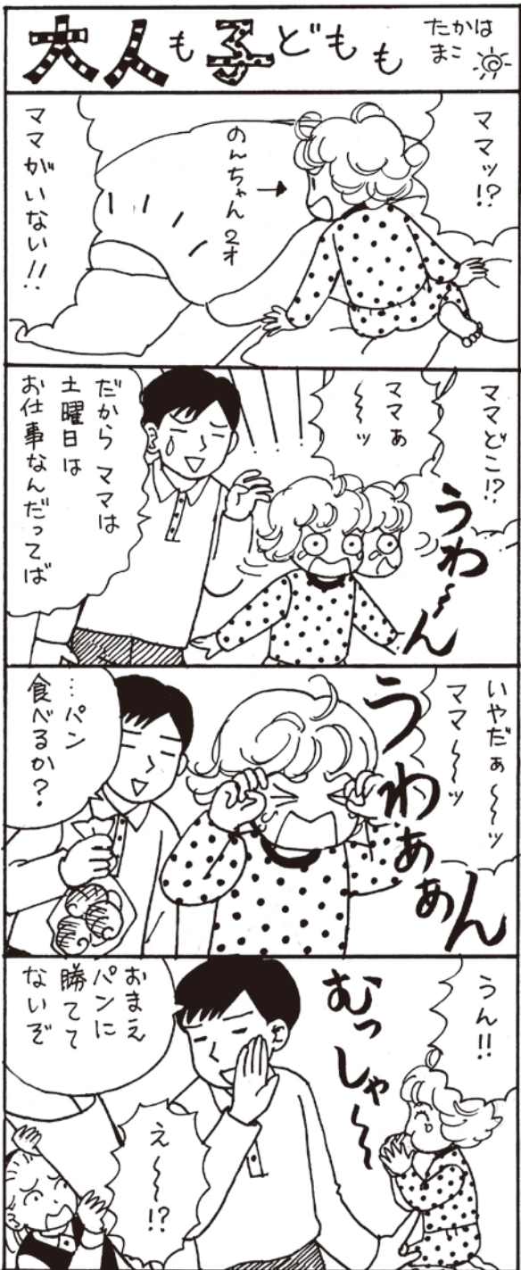
にこっと あいさんからのエピソードです。