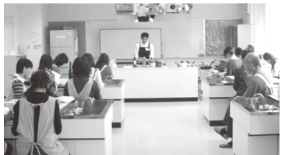
クッキングスタジオ

RESERVE 予約申請は、いきいき広場にて7日前～3ヶ月前(月初め)より受け付けています。