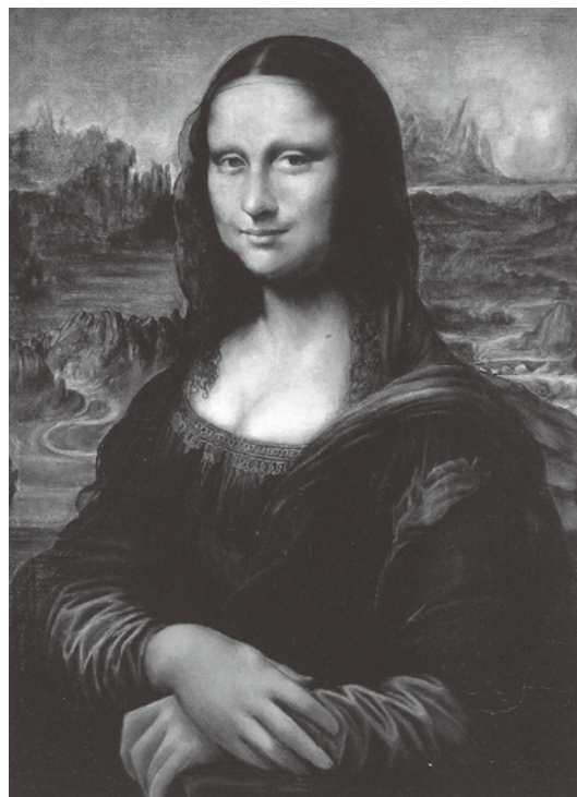
モナリザ模写作品 1973年 油彩(73.3×54.0cm)