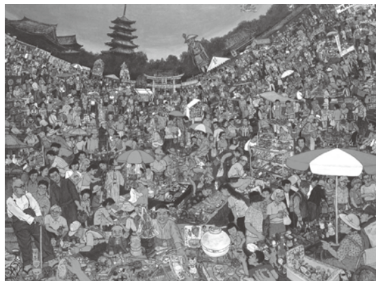
京都・東寺の弘法さん 2005年 油彩(193.1×259.1cm)