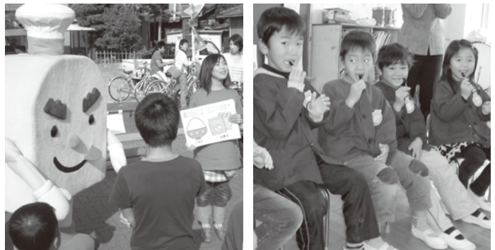
「カワラッキーの朝ごはんクイズ」「おせち料理の話の後に黒豆を食べました」 (鬼みちまつり) (高浜幼稚園)