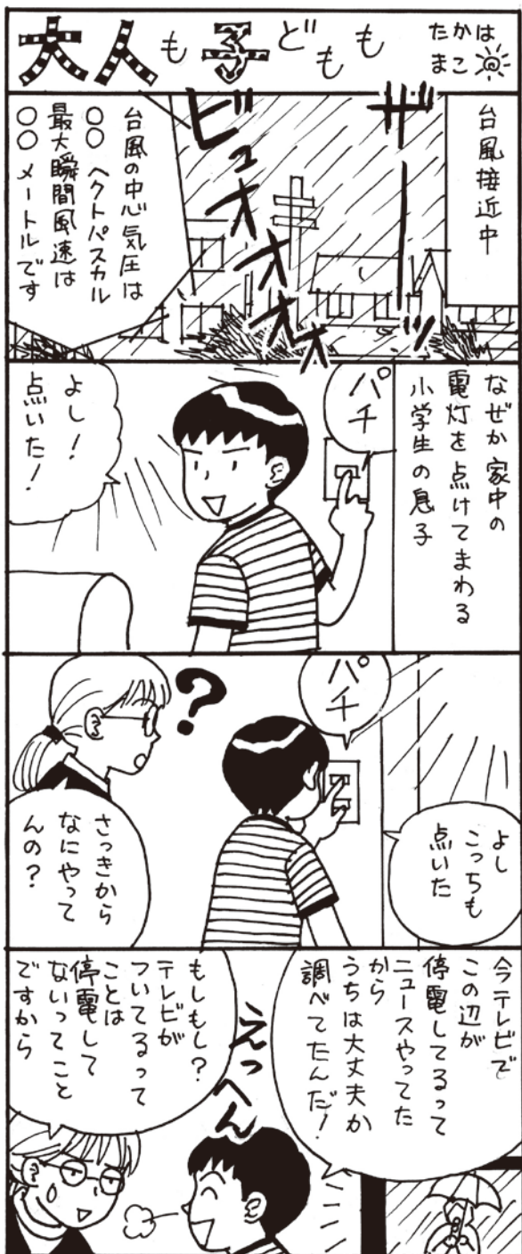
F.Kさんからのエピソードです。