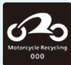
リサイクルマーク