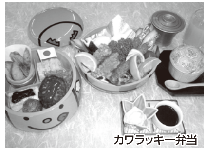
カワラッキー弁当

チャレンジの就労の場「カフェ&ベーカリーふるふる」で、安心安全な食の提供を目指し、国産小麦100%のパンで、カワラッキーラスクを考案し、その普及に協力されました。