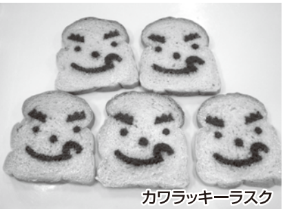
カワラッキーラスク