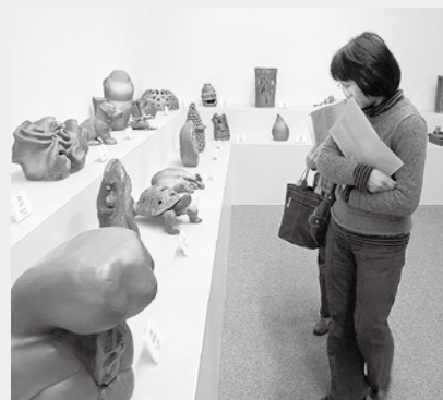
▲第4回飾り瓦コンクールの様子