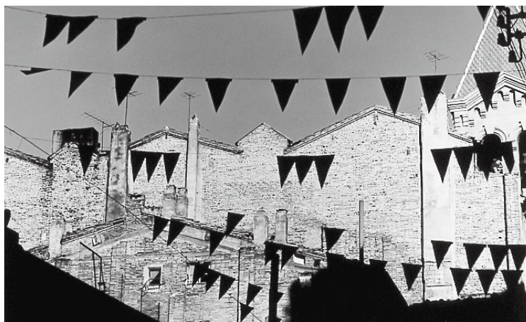
奈良原一高「スペイン北部の街並」1964年