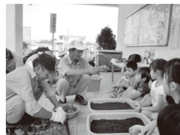
菊1本でまちづくり事業