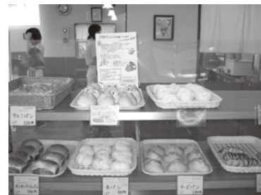
カフェ&ベーカリー「ふるふる」