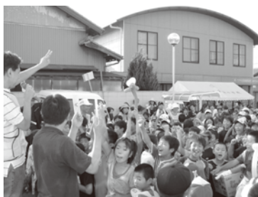
人形小路七夕祭り