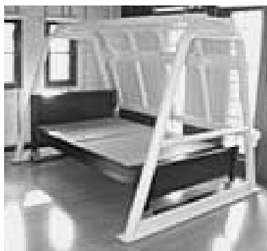
防災ベッドイメージ

※高浜市建築耐震研究会では、昭和56年6月1日以降に着工した木造住宅を対象に、簡易診断（無料）を行っています。