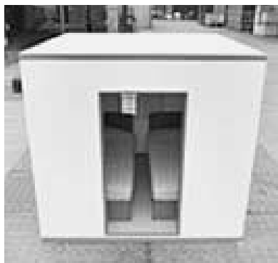
耐震シェルターイメージ

※防災ベッドとは、耐震シェルターと同様に生命を守るための装置で、金属製のフレームなどでベッドの上部を覆い、ベッド内の人を保護し就寝中の安全などを確保するものです。