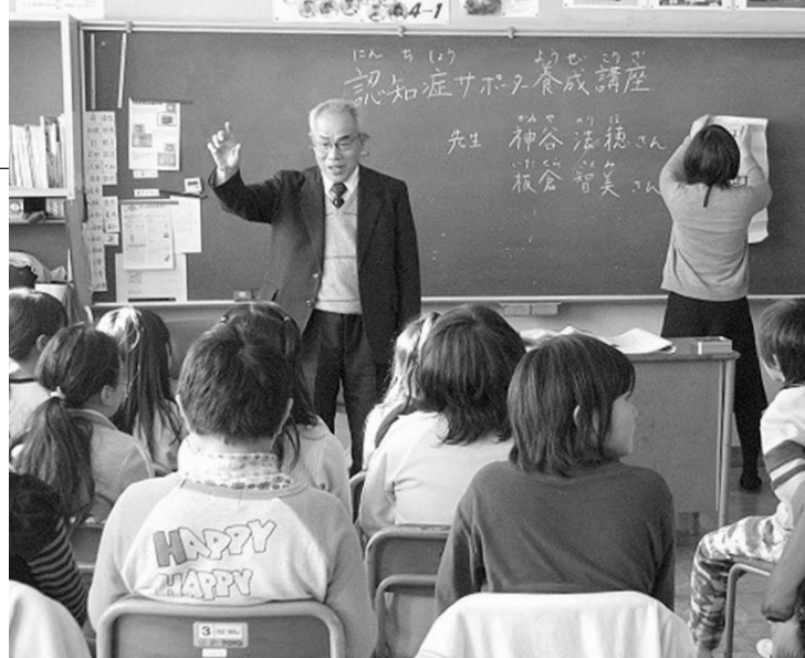
▲認知症サポーター養成講座の様子