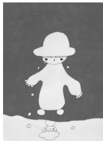
ほんめとしみつ「雪だるまの赤ちゃんエンエン」