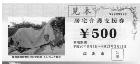
居宅介護支援券 見本