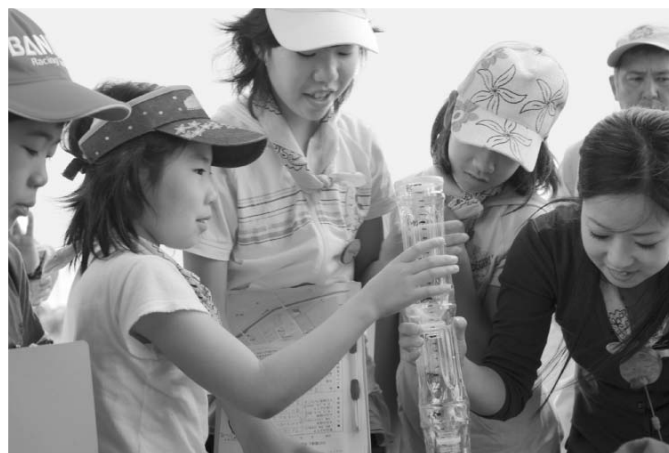
▲手作り透視度計で透視度測定中