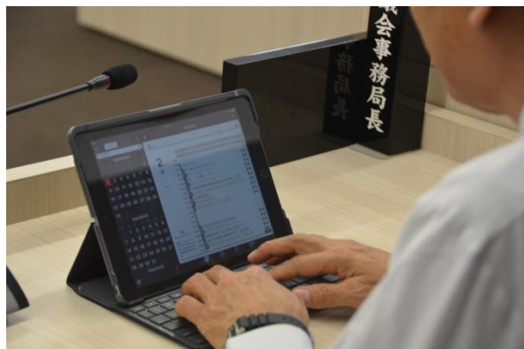
▲タブレット端末の操作研修会