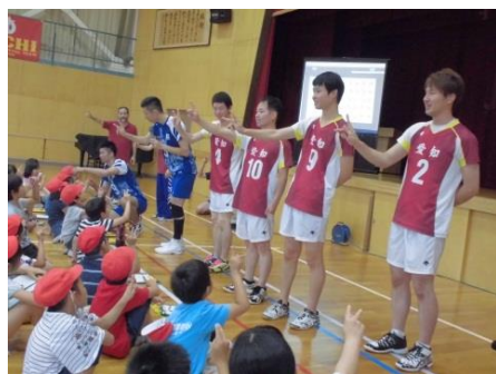
▲デフリンピックの選手と交流