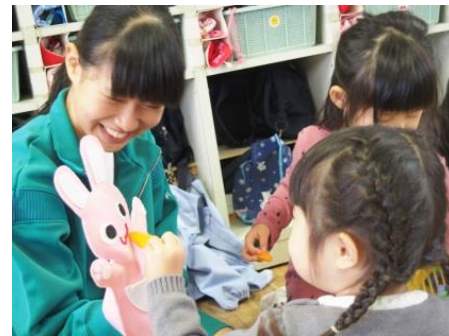
▲赤ちゃんふれ愛体験