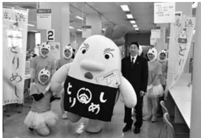
▲特別住民票を提出しました (平成25年4月1日)