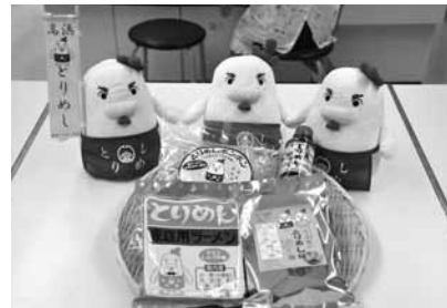
▲とりめし商品のPRにも 一役かっている