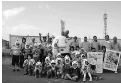
▲とりめし学会の活動に 参加して盛りあげる