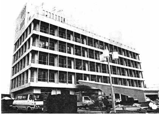
▲現庁舎竣工時の写真『広報たかはま』S52.3.1号