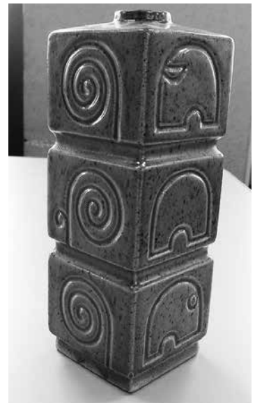
▲地元陶芸家の手による花器