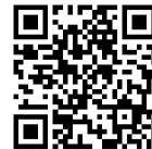
専用申込フォーム

※ WEB申込ができない場合は、下記のコールセンターまでご連絡ください。 専用申込用紙をご案内いたします。 ※ 用紙で申し込む場合は、WEB申込と異なり、店舗写真など一部掲載できない情報がありますので予めご了承ください。