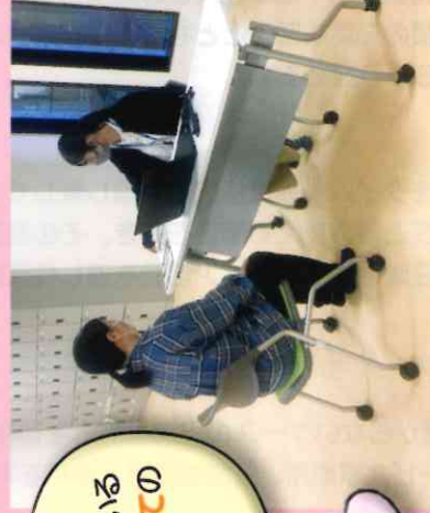
高浜市社会福祉協議会 マスケットキョウクタン こころん

ボランティアをやって みたい方への相談サ ポート、イベントを盛 り上げてくれるボラン ティアの紹介等、ボラ ンティアに関するサ ポートをしています。