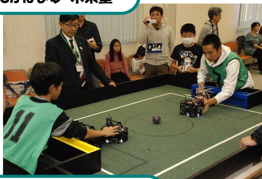
たかはま夢・未来塾