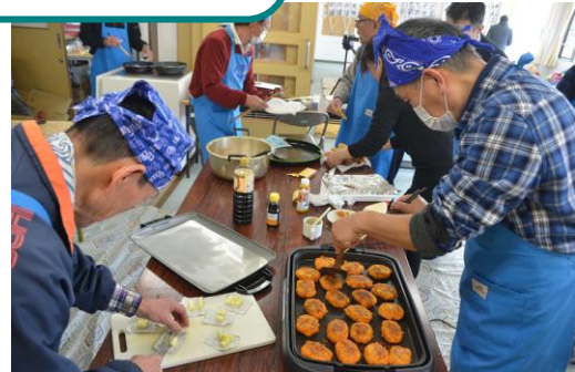
男のレシピ研究会