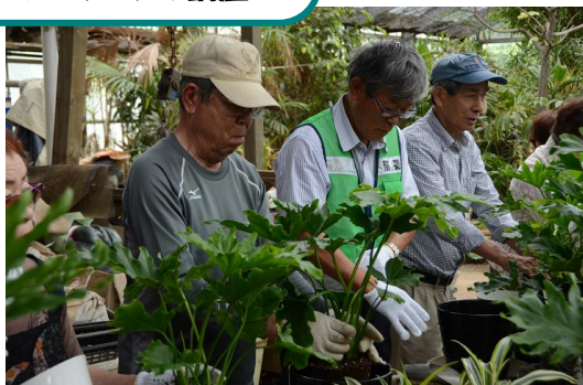
ガーデニング講座