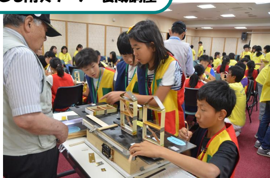
子ども防災リーダー養成講座