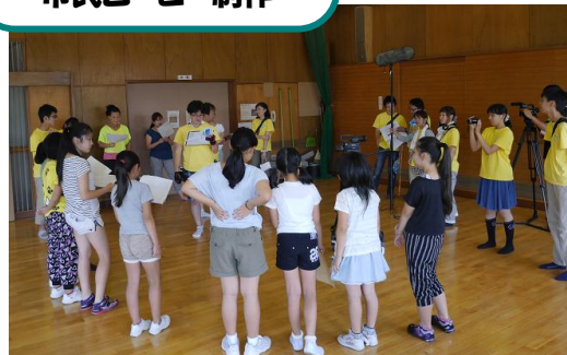
市民ムービー制作