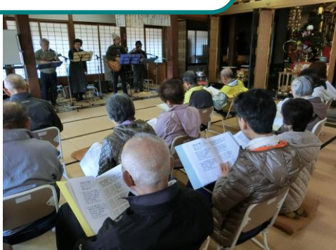
健康自生地ウォーキングツアー