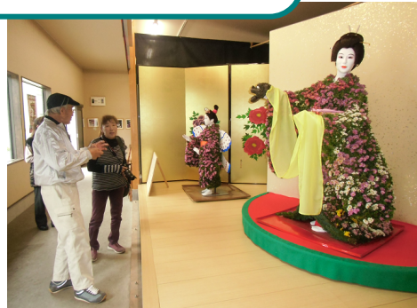
市無形文化財「菊人形づくり」