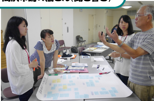
高浜市誌の編さん(聞き書き)