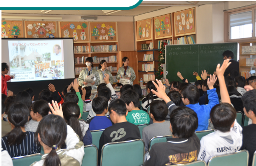
自治基本条例出前授業