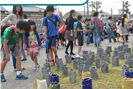
鬼みちまつり(鬼あかり展示)