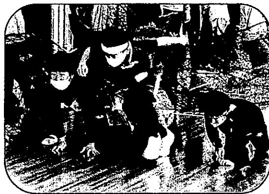
【ふれあい運動事業】 青木町・春日町・沢渡町・稗田町合同運動会