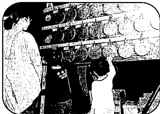
【子ども作品展事業】 鬼みちまつり