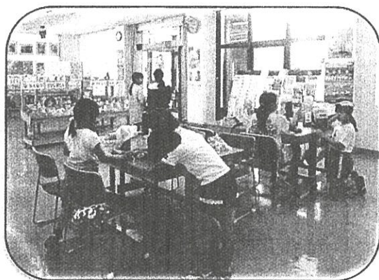
【地域の茶の間運営事業】 高浜ふれあいプラザ1階「茶の間」