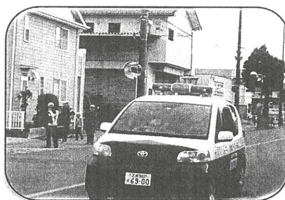
【児童の登下校時安全見守り事業】 児童下校見守り