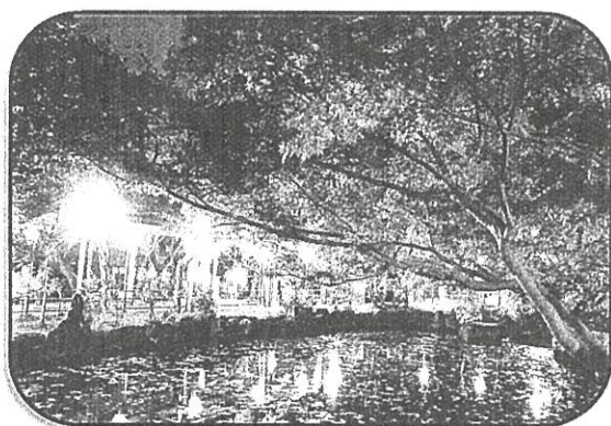
【大山魅力アップ事業】 心字池もみじライトアップ