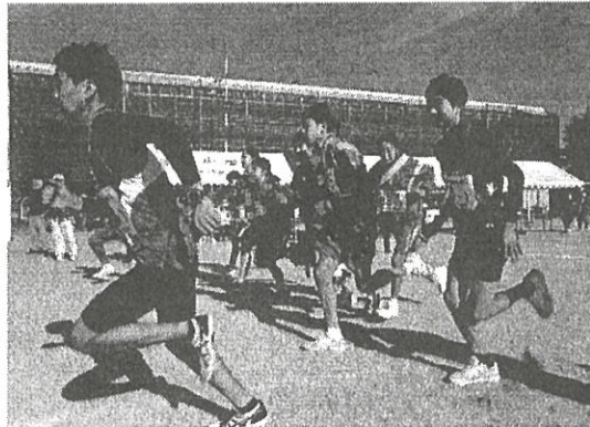
大家族ひえだ川駅伝