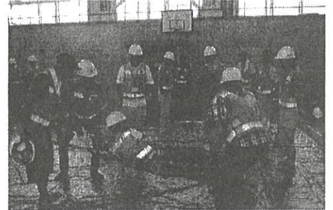
高浜市総合防災訓練