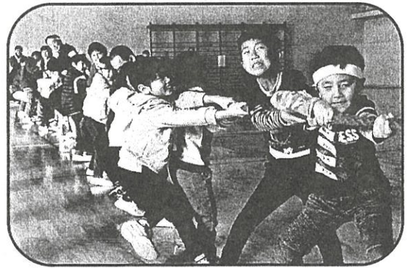
【ふれあい運動事業】 運動会