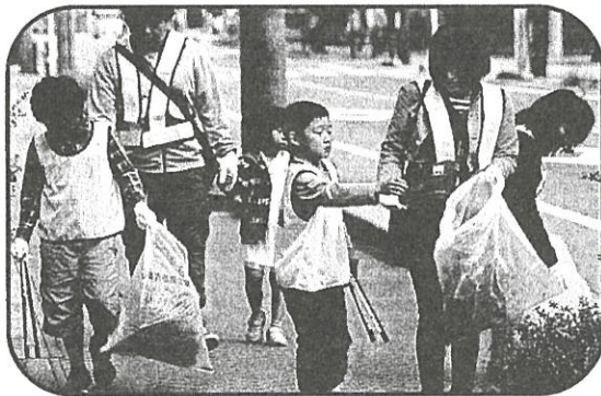
【クリーン・グリーン事業】 鬼みち歩こう大作戦