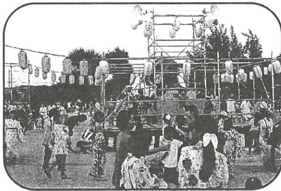
【夏まつり事業】 盆踊り