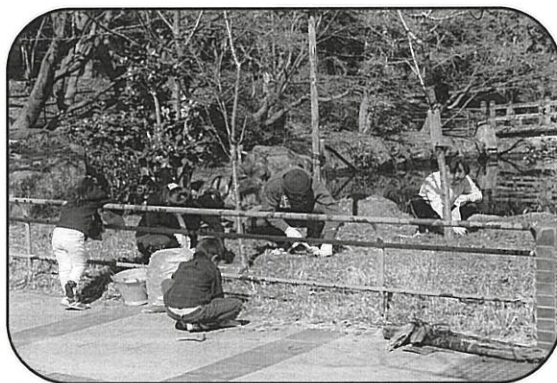
【大山里親事業】 桜里親会