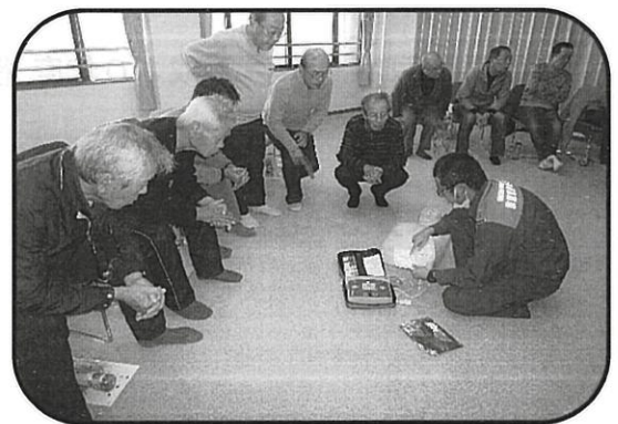
【防災対策事業】 普通救命講習会

日 時 平成30年5月25日（金） 午後7時より 場 所 高浜市女性文化センター