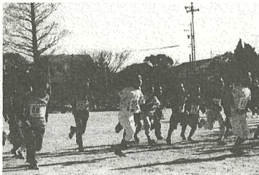
大家族ひえだ川駅伝