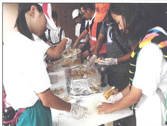
総合防災訓練(炊出)