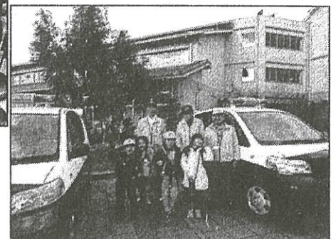
青パト同乗パトロール体験