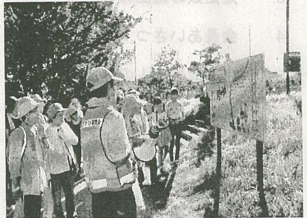
稗田川観賞ウォーキング