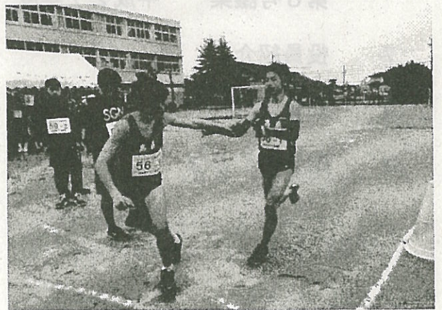
大家族ひえだ川駅伝

日時 平成27年5月18日(月) 午後7時00分から 会場 高取公民館 会議室(1階)