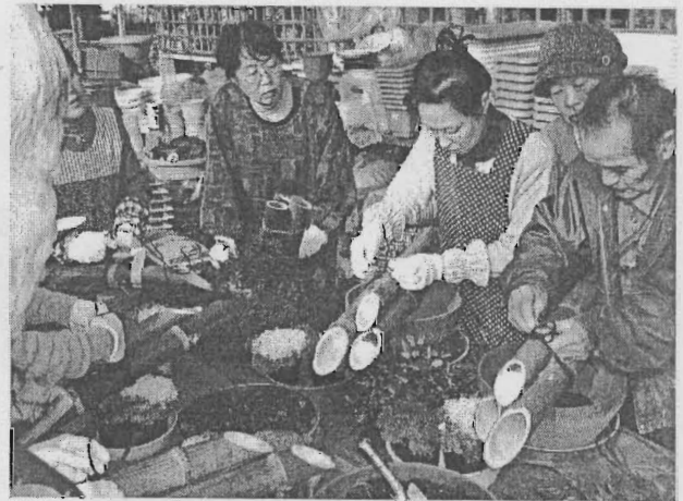
ガーデニング講習会