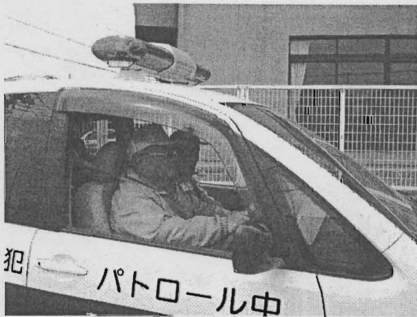
たかとりブルーパトロール