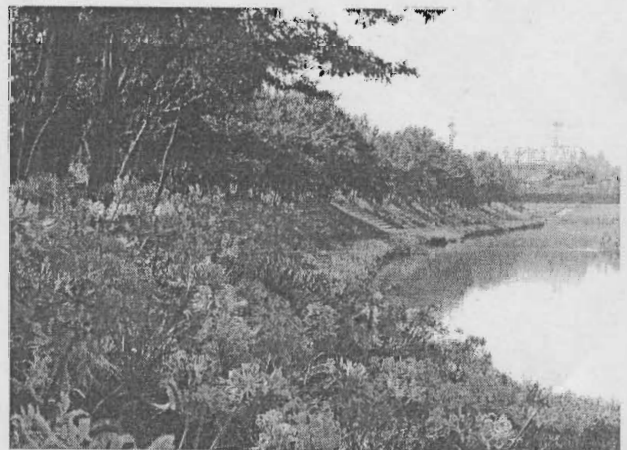
稗田川へ彼岸花植栽