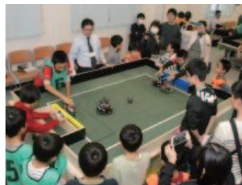
ロボットクラブ高浜ノード大会