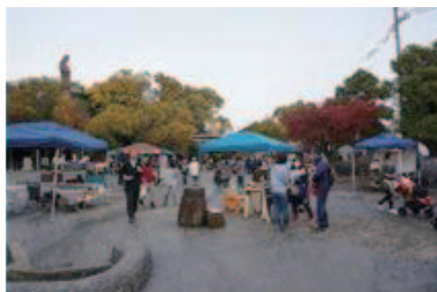
ロハスガーデンマルシェ