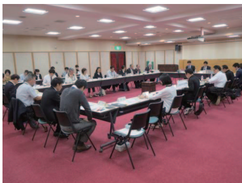
▲高浜市子ども貧困対策会議