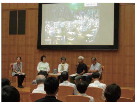
みんなで語ろう！「鬼のみち」 よもやま話