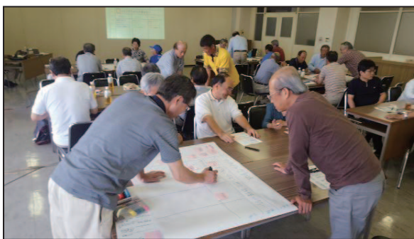
(基礎編：地域防災活動のワークショップ)