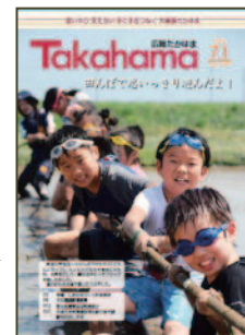
「広報たかはま」7/1号 愛知県広報コンクール 写真部門（一枚写真） 「奨励賞」受賞 ▶