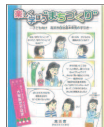
▲高浜市自治基本条例 子ども向け副読本