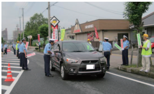
(交通安全啓発活動)