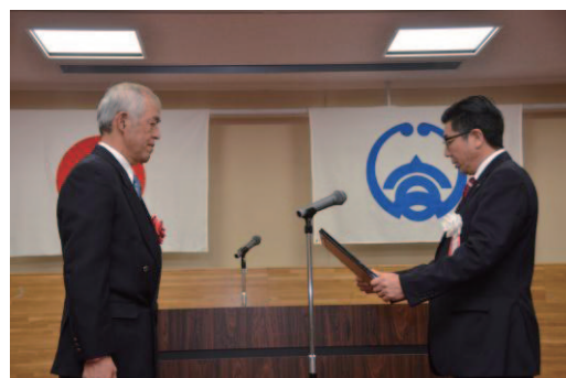
(写真：市民表彰式当日の様子)