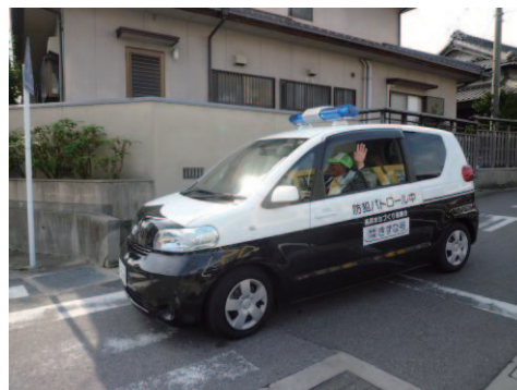
(青色防犯パトロール)