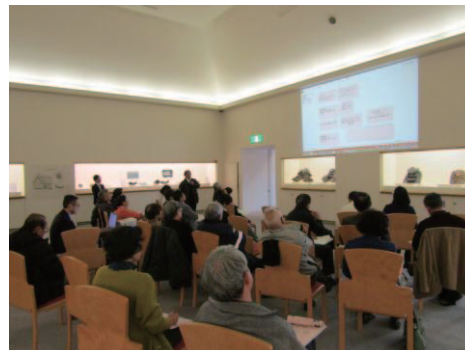
美術館モノコトギャラリーを会場に