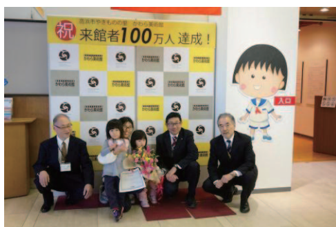
来館者 100 万人達成