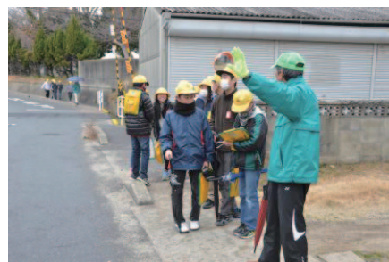
▲防災マップ作成のための調査（高浜小）