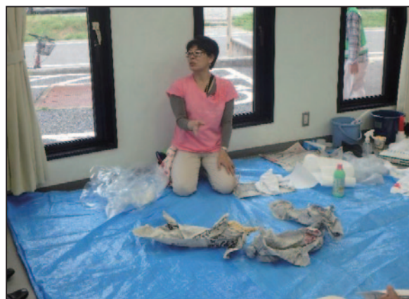
(避難所編：ノロウィルス蔓延防止の実演)