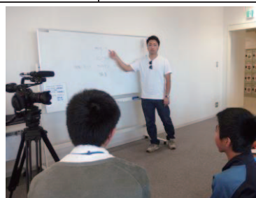
▲キャリア教育の実施