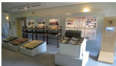
常設展示リニューアル3階