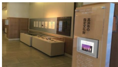
常設展示リニューアル1階