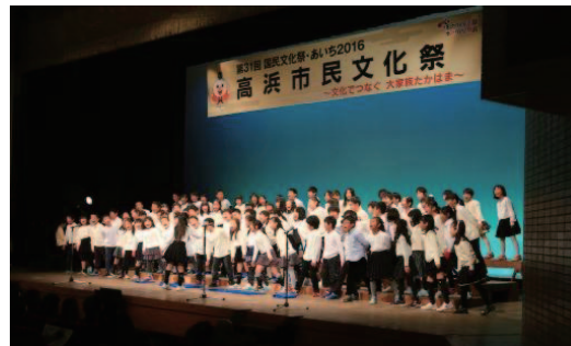
第 31 回国民文化祭あいち・2016 高浜市民文化祭