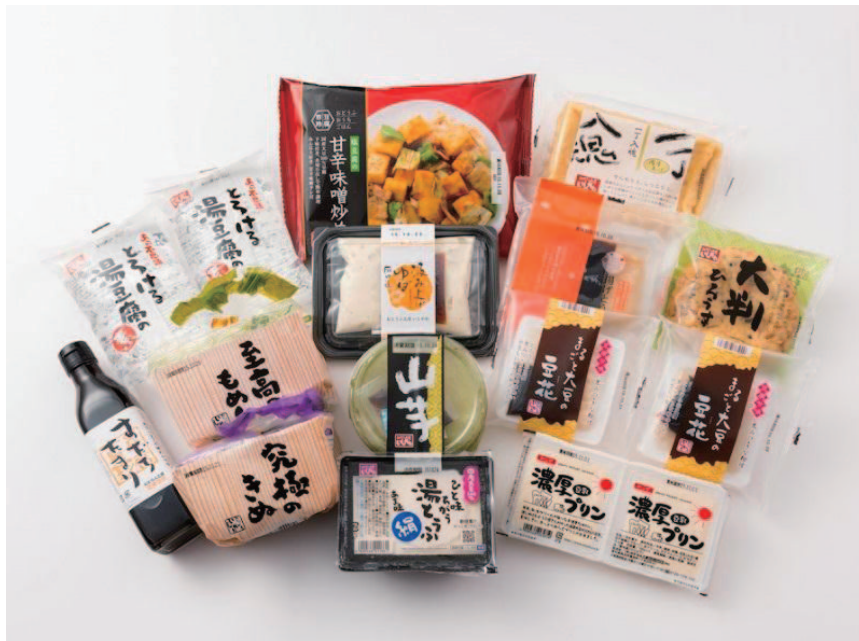
(写真：ふるさと応援寄附金謝礼品の例)