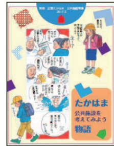
公共施設特集 (別冊) ▶