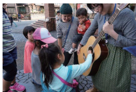
音楽ワークショップ