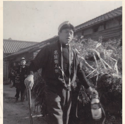
▲八幡社のトチチンコ

昭和30年ごろに吉浜地区の八幡社で、神社の参道を人馬が駆け抜ける「トオシ」が行われていた時代を記録として残します。