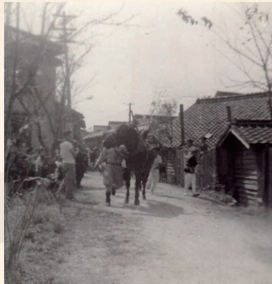
▲八幡社のトオシ