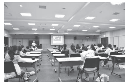
▲高浜の防災を考える市民の会 「子ども防災リーダー養成講座」