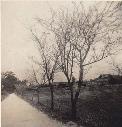
▲駆け抜けた桜並木

「昔はこんなことがあったよ!」「家からこんな古い写真が出てきた!」などといった情報がありましたら、ぜひお寄せください。あなたのその情報が、これからの“高浜市のあゆみ”をつむぎ、後世へつなぐ鍵になるかもしれません。