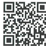
【高浜市防災メール】

*高浜市防災メールとは異なる、特定の災害リスクに特化した専用メールです。高浜市防災メールと併せて登録（→右記のQRコード）をお願いします。