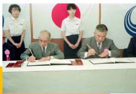
瑞浪市・高浜市 姉妹都市提携調印式