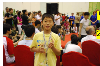
平成20年 「たかはま夢・未来塾」 世界大会ロボカップ 2008蘇州大会で優勝