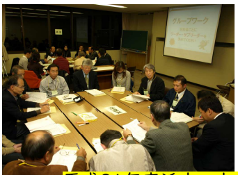
平成21年高浜市の未来を描く市民会議