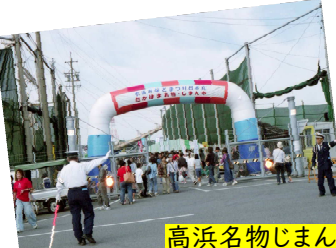
高浜名物じまん市