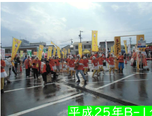
平成25年B-1グランプリin豊川 「高浜とりめし」8位入賞