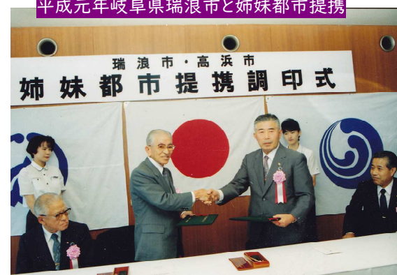
平成元年岐阜県瑞浪市と姉妹都市提携