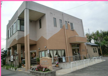
平成17年高浜南部まちづくり協議会設立 平成18年高浜南部ふれあいプラザオープン