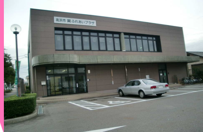
平成20年翼まちづくり協議会設立 翼ふれあいプラザオープン