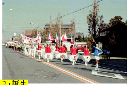
創作踊り「チャラポコ」誕生