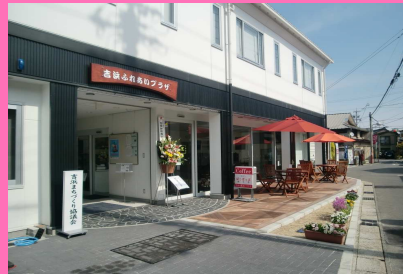
平成19年吉浜まちづくり協議会設立 平成22年吉浜ふれあいプラザオープン