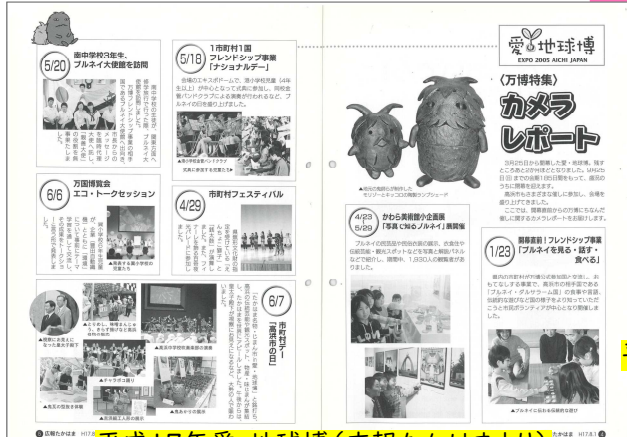
平成17年愛・地球博