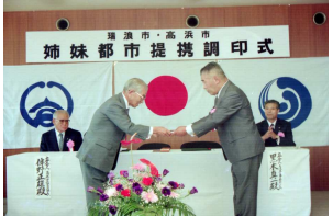
瑞浪市・高浜市 姉妹都市提携調印式