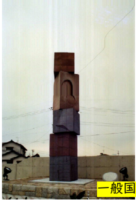
一般国道419号高浜バイパス開通