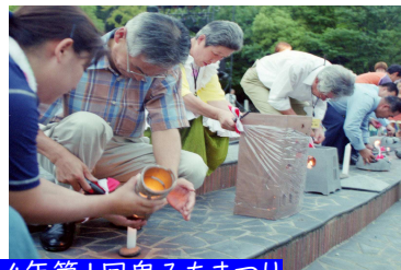
平成14年第1回鬼みちまつり