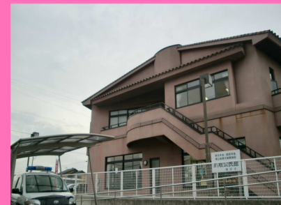
平成20年高取まちづくり協議会設立 令和3年高取ふれあいプラザオープン