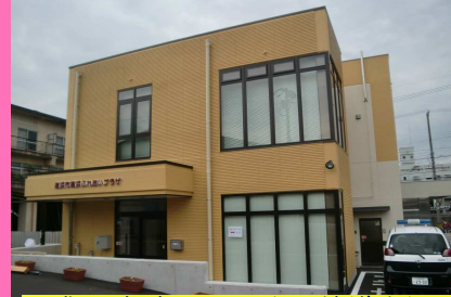
平成21年高浜まちづくり協議会設立 高浜ふれあいプラザオープン