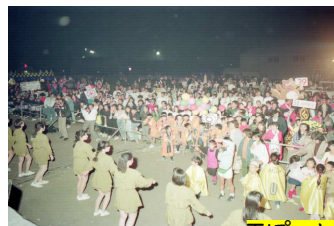
丁ぽーとフェスタ