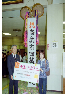
平成15年人口4万人達成