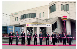
平成7年三河高浜駅橋上駅完成