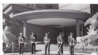
平成7年やきものの里かわら美術館開館