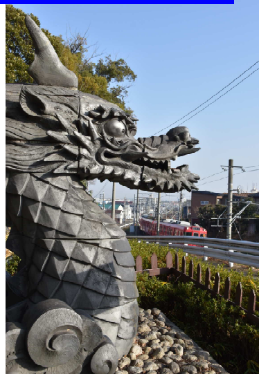
鬼のみち沿い急傾斜地「飾り瓦」完成