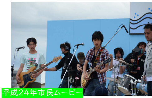
平成24年市民ムービー 「タカハマ物語」公開