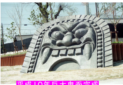
平成10年巨大鬼面完成