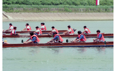
平成8年第1回「高浜市民レガッタ」