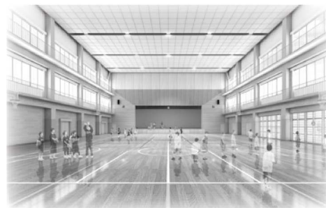
▲メインアリーナ イメージ図