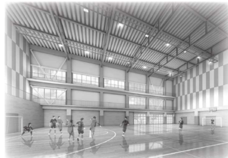
▲サブアリーナ イメージ図