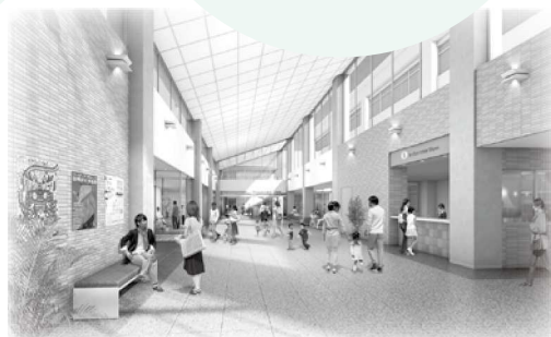
▲エントランス イメージ図