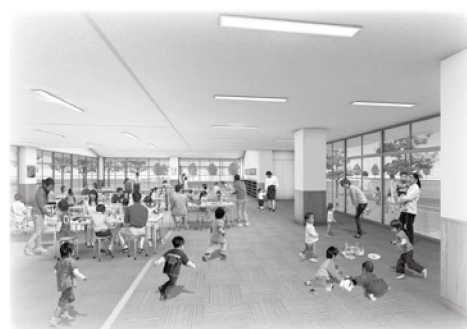
▲児童センター イメージ図