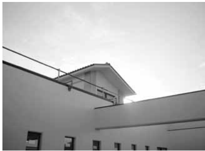
“風の塔”を階段に合わせて4か所設置