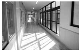
“光庭”により自然光を取り込む。 ルーフトラスは児童の憩いの場にも