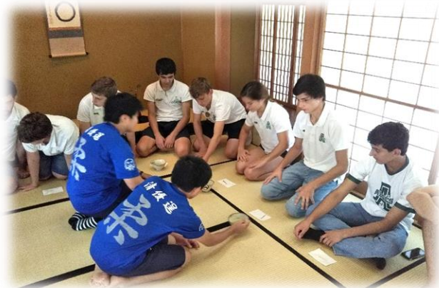
茶道体験(ポルトガル柔道チームと)