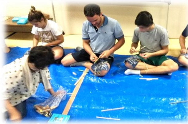
お箸作り(ポルトガル柔道チームと)

柔道で心身を育てるだけでなく、食育で家族の絆を深め、国際交流で視野を広げる活動にも取り組んでいます。2カ月に1回程度、クッキングスタジオで食育活動をしています。