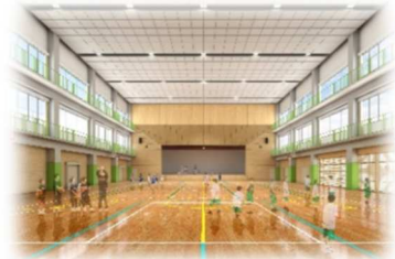
▲メインアリーナ イメージ図