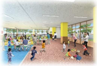
▲児童センター イメージ図