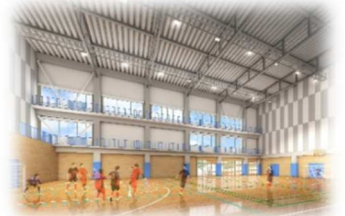
▲サブアリーナ イメージ図