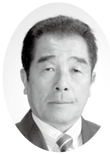
鈴木 勝彦 議員