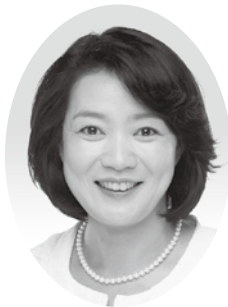
神谷 直子 議員