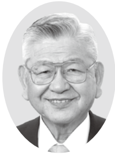
黒川 美克 議員