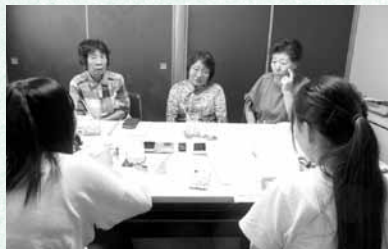
▲吉浜地区婦人会活動調査