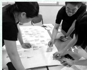
▲質問内容を考えるようす(上2枚)