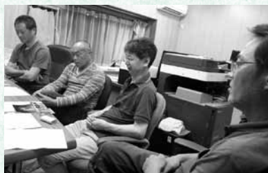
▲高取地区の青年団活動調査