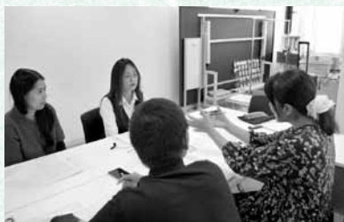
▲ニューカマー調査