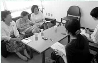
▲高浜市婦人の会調査